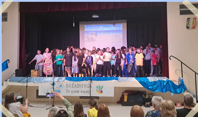
4 juin - Comédie musicale : Océanopolis