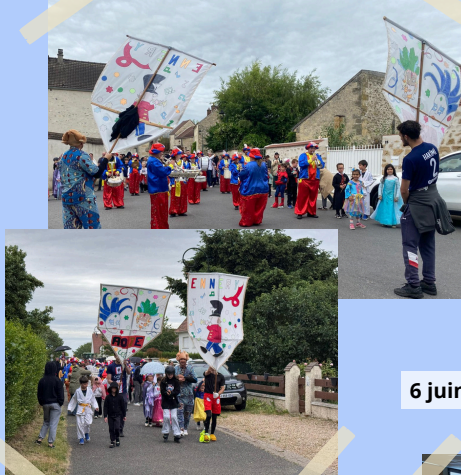
6 juin - Carnaval de l'AOJE