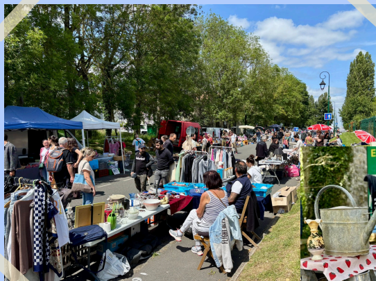
7 juin : Brocante