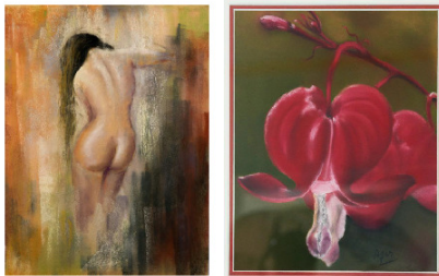
Agnès CHESLET, Marie - Claude DE LEECK Et leurs ami(es) peintres Samedi : 14h - 19h Dimanche : 10h - 12h / 14h - 18h

ENNERY - FOYER RURAL 4 et 5 mars 2017 EXPOSITION DE PEINTURE