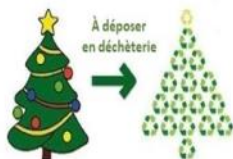
Après avoir été décoré, votre sapin sera composté !

Aucun sapin de Noël ne sera collecté en porte à porte (ordures ménagères), même présenté dans un sac à sapin