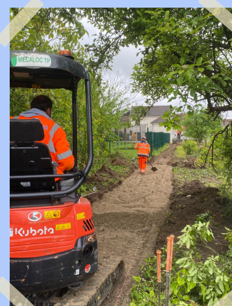
Début des travaux de la Sente de la Croix