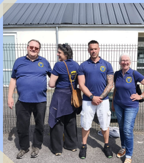
21 mai : Olympiades scolaires à Auvers-sur-Oise