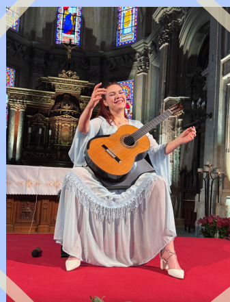
17 mai : Concert de Vera Danilina pour le Festival d'Auvers-sur-Oise à l'église d'Ennery