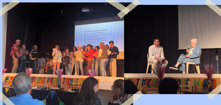
9 mai : 60 ans de l'AOJE